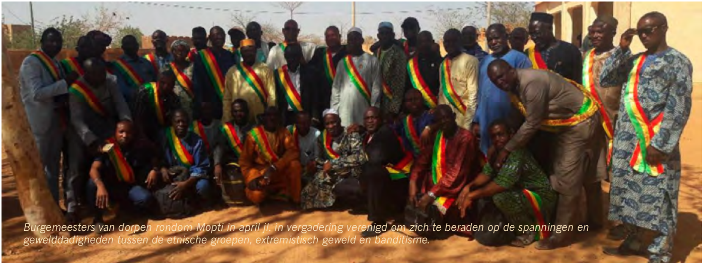
Burgemeesters van dorpen rondom Mopti in april jl. In vergadering verenigd om zich te beraden op de spanningen en gewelddadigheden tussen de etnische groepen, extremistisch geweld en banditisme.